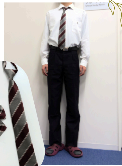
ネクタイ・リボン 着用のタイミング

襟の有無や丈の長さが違います。性別にかかわらず、どちらも選択できます。ノンカラージャケットの方は、下にセーラー服を着て襟を出すことができます。