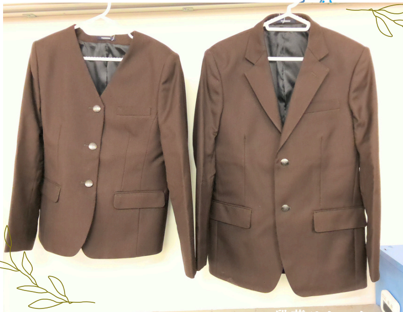
ノーカラージャケット