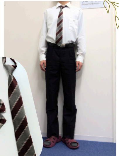
ネクタイ・リボン 着用のタイミング

襟の有無や丈の長さが違います。性別にかかわらず、どちらも選択できます。ノーカラージャケットの方は、下にセーラー服を着て襟を出すことができます。