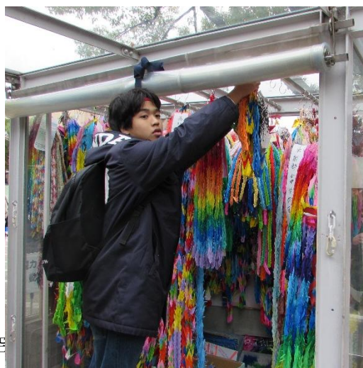
大阪の見学の様子